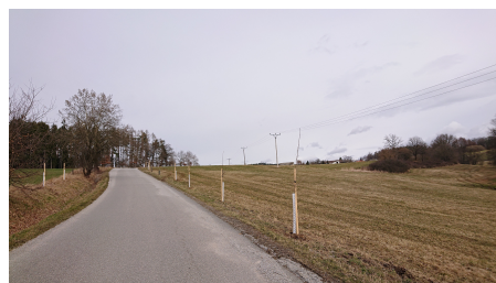
Směr Bílsko-Netonice, od poldru

standardní klima přípravného týdnu školy, kdy právě vrcholily ony přípravy, přerušila karanténa většiny pedagogického sboru z důvodu kontaktu s pozitivně testovanou osobou. Lektor, kterého jsme měli objednaného pro další vzdělávání pedagogických pracovníků na tento termín celé dva roky dopředu, se před svým seminářem u nás ve škole setkal s někým, kdo byl také pozitivně testovaný. KHS nařídila povinnou 14-ti denní karanténu všem zúčastněným a komplikace byla na světě. Tedy tak, jak netradičně skončil školní rok předchozí, tak netradičně jsme začali i školní rok nový. Naším žákům jsme pro odložený začátek školního roku prodloužili prázdniny o 9 dní.