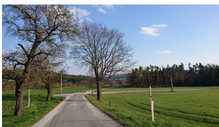
křižovatka, doprava Záluží, doleva Chrást