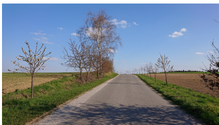
směr od Netonic ke křižovatce (Chrást-Záluží)

Při jarních procházkách jste si možná všimli nových ovocných a listnatých stromů, vysazených podél cest. Díky přiznané dotaci pro Obec pracovníci zahradnické společnosti Šíp ze Strakonice na začátku března 2021 vysadili v našem katastru přes 80 statných javorů, kaštanů a lip . K silnici mezi Zálužím a Chrástem přišly jeřabiny a směrem na Chmelovku za Zálužím ovocné stromořadí . Nedávno byla obec oslovena další nabídkou výsadby ovocných stromů společností Stromky a med z Vitic , která pěstuje stromky na úbočí Hradu z druhé strany a nabízí je zájemcům i v maloprodeji. (LK)